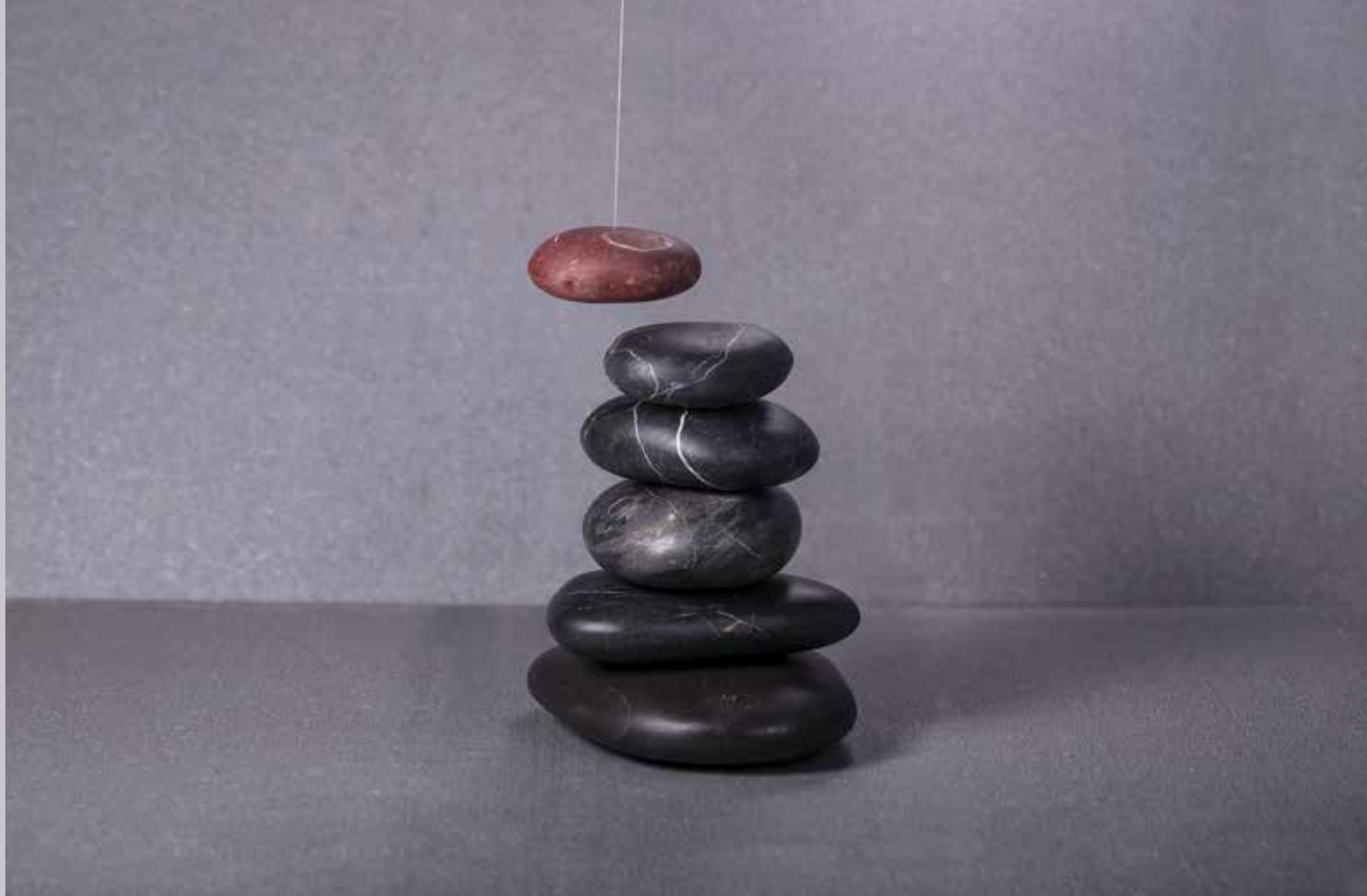
İŞIK ÖZÇELİK "ÖTEKİ" 2014 | TAŞ, MIKNATIS-ÇELİK, İP 45x45x28 cm