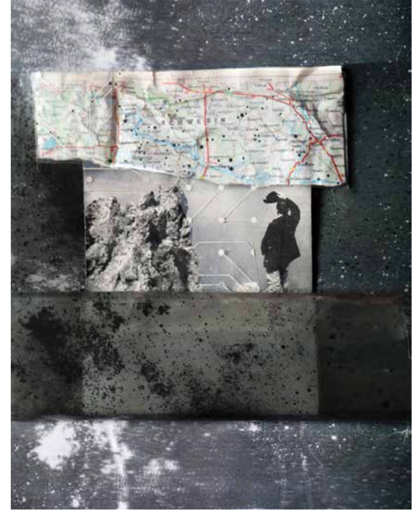
ÖZGE ENGINÖZ “İSİMSİZ” 2014 | KOLAJ, KAĞIT ÜZERİNE ASETAT 23,5x29 cm