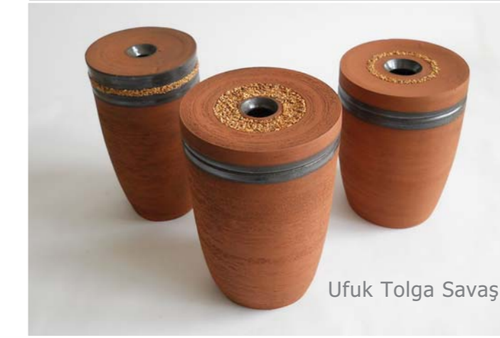
Ufuk Tolga Savaş