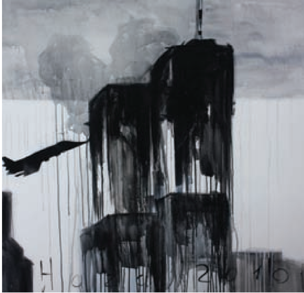
Tuval üzerine karışık teknik, 110 x 110 cm