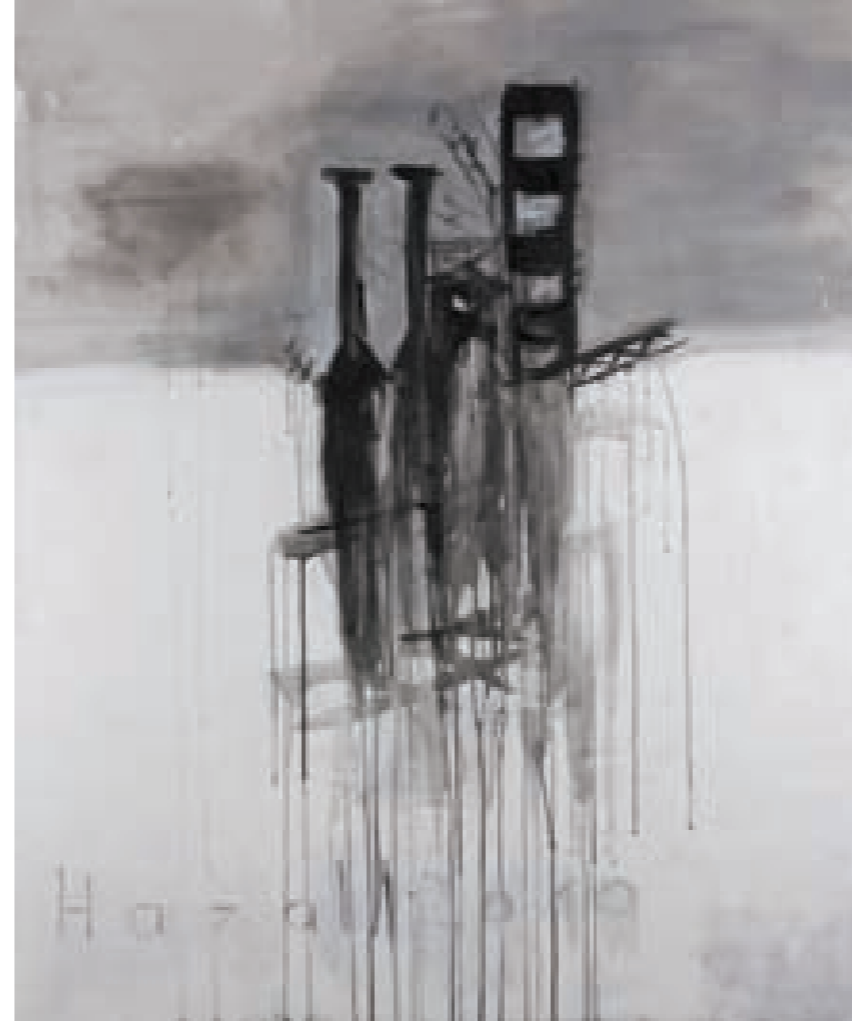
Tuval üzerine karışık teknik, 110 x 110 cm