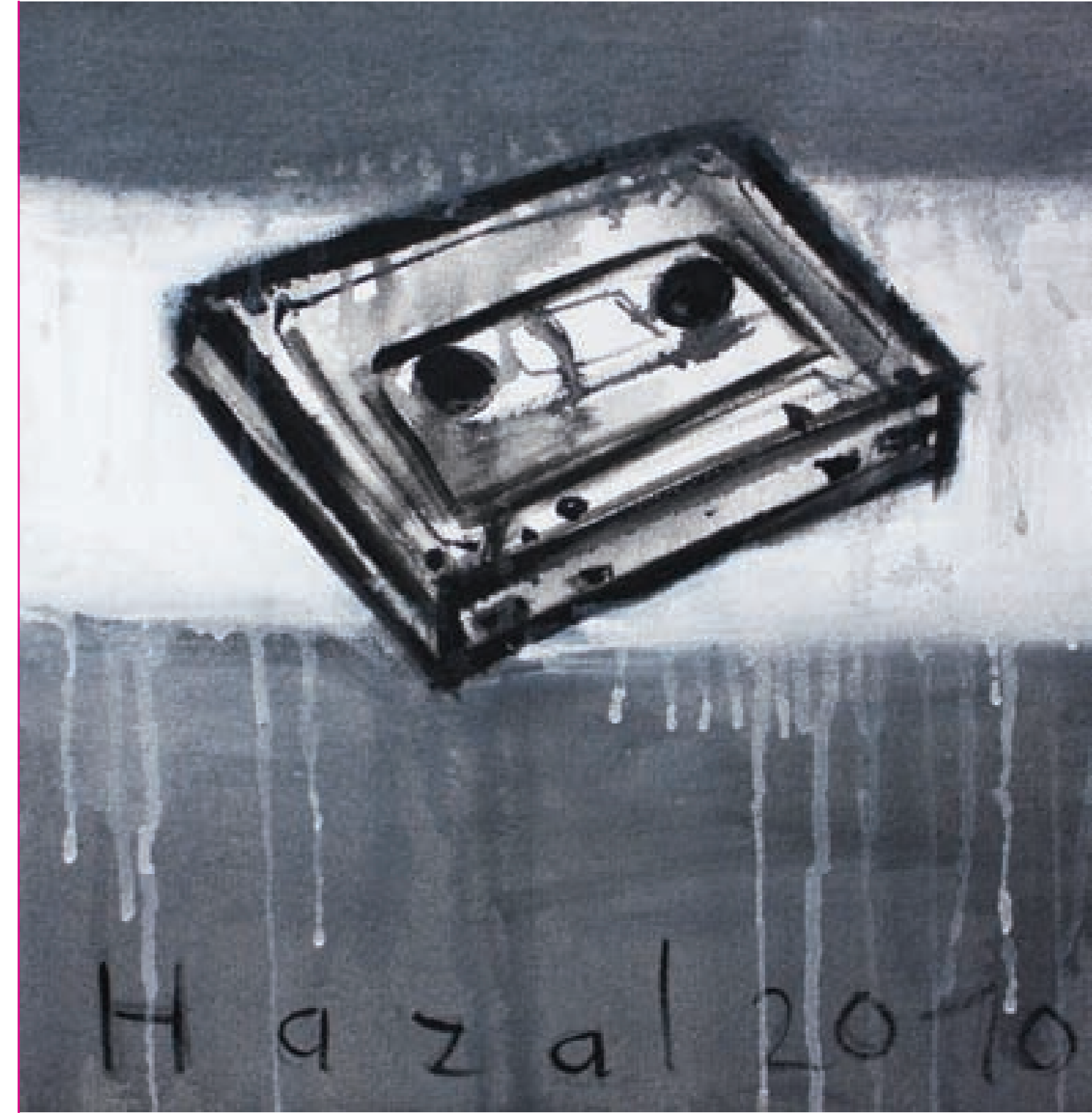
Tuval üzerine akrilik baskı, 30 x 30 cm (sağ sayfa)