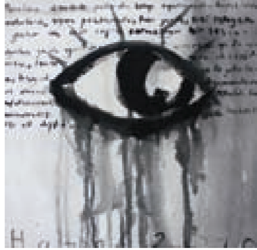
Tuval üzerine akrilik, 30 x 30 cm